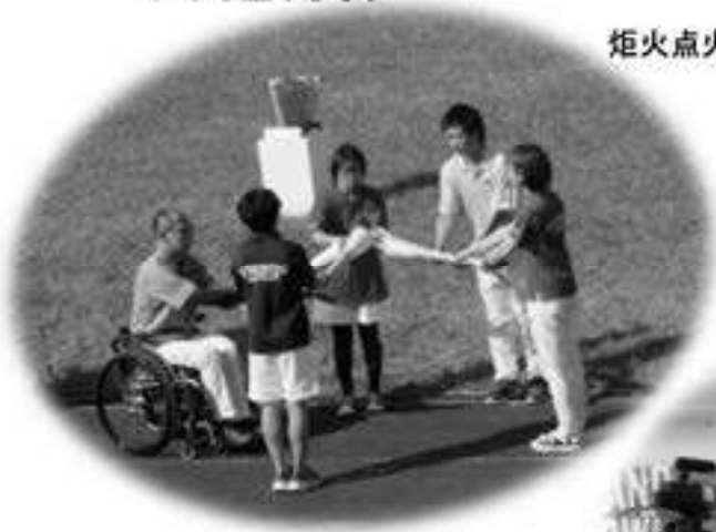
新たな式典映像コンテンツ 制作出演