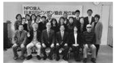
三重県 SS ピンポン協会

◆三重県障がい者スポーツ協会競技団体メンバー募集 参加してみたい方、興味のある方は・・・