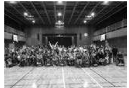
みえボッチャ協会