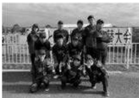
県知的障がい者 フットベースボールチーム