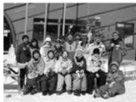
県障害者スキー協会