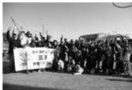
NPO 法人セイラビリティ三重