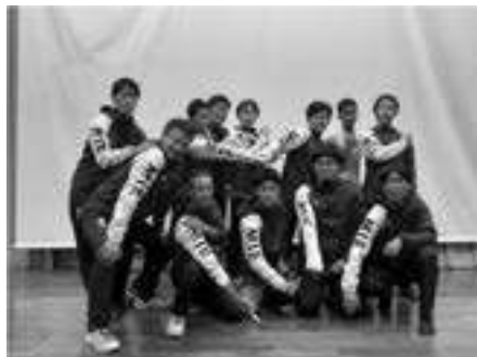
三重ボーイズ 【県聴覚障がい者バレーボール部】