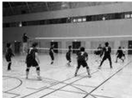
県精神障害者スポーツ (バレーボール) 連絡会