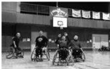
三重チャリオッツ