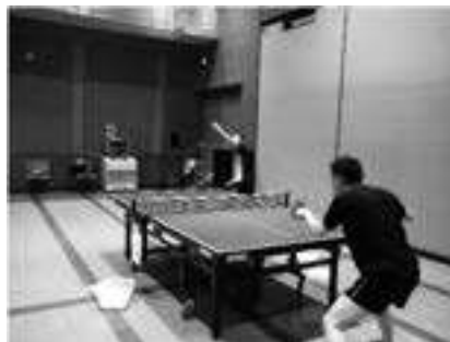
県障がい者卓球協会