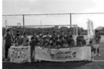
県ハンディキャップ サッカー連盟