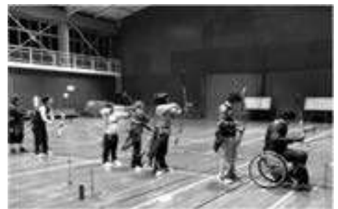
県アーチェリー協会 シューティングスターズAC