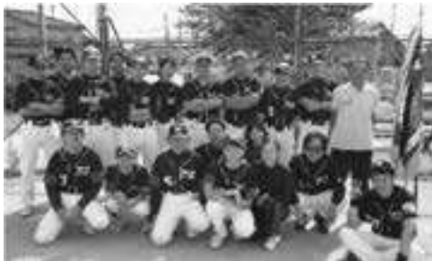
県視覚障害者協会 グラウンドソフトボール部