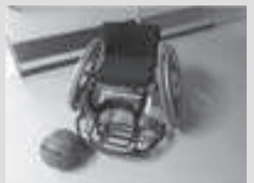
競技用車いす(バスケット)