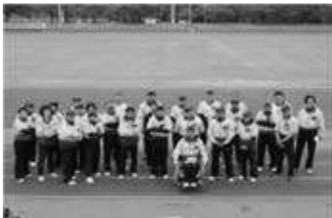
県障害者フライング ディスク協会