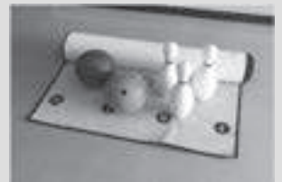
室内用ボウリング

お問合せ先：三重県身体障害者総合福祉センター 障がい者スポーツ推進課 TEL 059-231-0800 FAX 059-231-0801