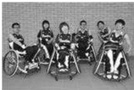
三重フロンティアズ