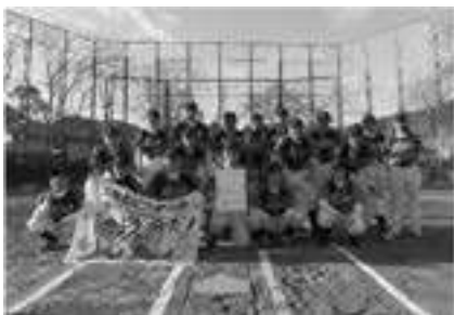
県知的障がい者 ソフトボールチーム