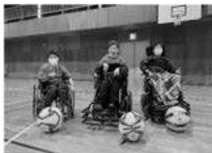
県電動車椅子サッカー協会