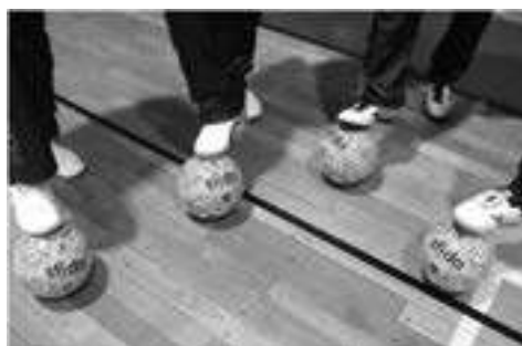
三重ソーシャル フットボールコミュニティ