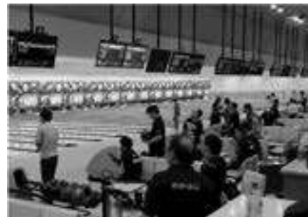
県知的障がい者 ボウリング協会