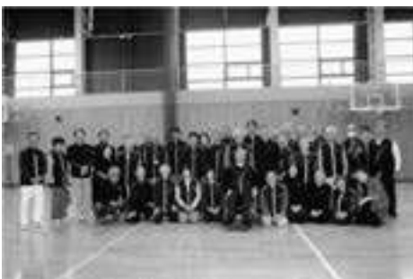
県身障者 スポーツウエルネス吹矢協会