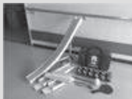
ポッチャ・ランプ