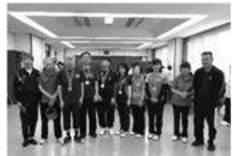
県視覚障害者協会 サウンドテーブルテニス部