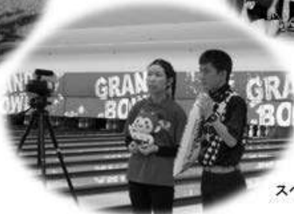
スペシャルメッセージ