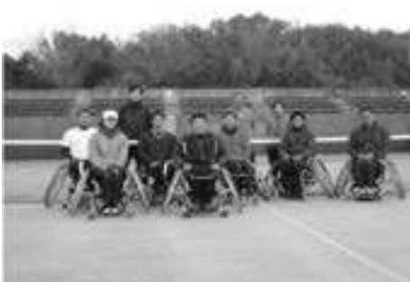
県車いすテニス協会