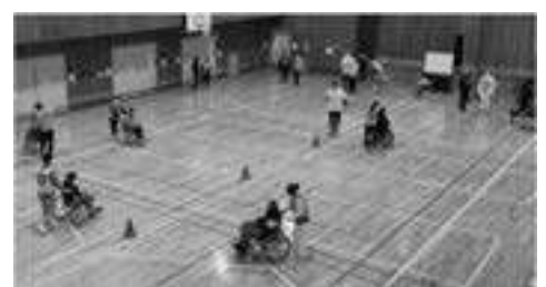
一般社団法人 みえのパラスポーツ