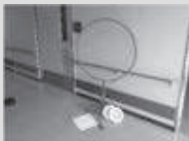
フライングディスク

三重県身体障害者総合福祉センターでは、気軽にスポーツを楽しんでいただけるよう、スポーツ用具の貸し出しを行っています。詳しくは、ご来所、お電話、FAXでお問い合わせください。