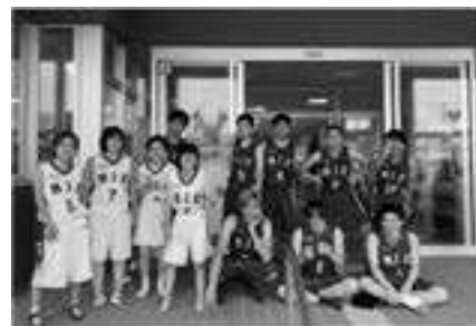
県知的障がい者 バスケットボールチーム