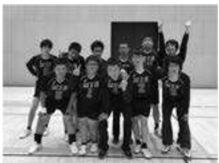
三重ファイターズ 【県知的障がい者バレーボールチーム】