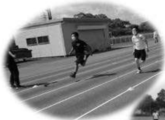
強化・育成練習会

三重県障がい者スポーツ協会事務局 三重県津市一身田大古曾 670 番地 2 三重県身体障害者総合福祉センター内 TEL059-231-0800 FAX059-231-0801