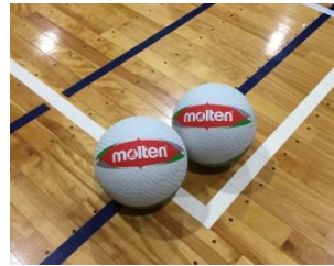
県精神障害者スポーツ (バレーボール) 連絡会