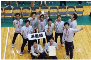
県聴覚障がい者バレーボール部 三重ボーイズ