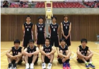
県知的障がい者 バスケットボールチーム