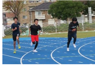
みえ障がい者陸上競技協会