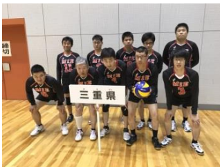
県知的障がい者バレーボールチーム 三重ファイターズ