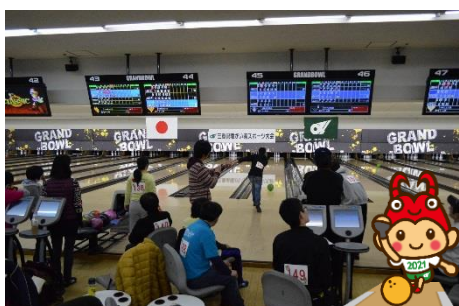
ボウリング 平成30年12月15日(土)