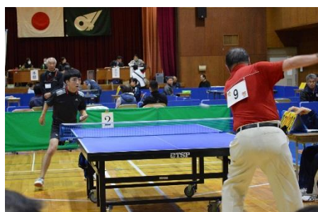
一般卓球 平成31年2月2日(土)