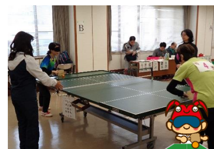
サウンドテーブルテニス 平成31年1月20日(日)