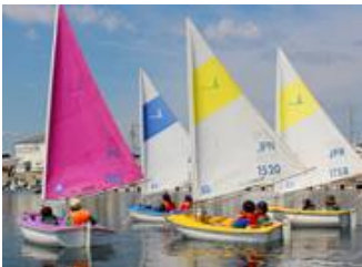
セイラビリティ三重