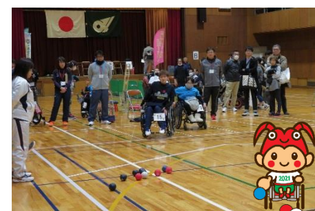
ボッチャ 平成31年1月27日(日)