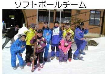
県障害者スキー協会