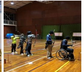
県アーチェリー協会 シューティングスターズAC