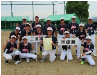
県知的障がい者 ソフトボールチーム