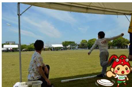
フライングディスク 平成30年5月12日(土)

第21回三重県障がい者スポーツ大会は、6競技に1074名の参加があり、熱戦が繰り広げられました。