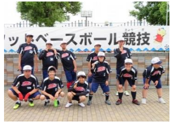
県知的障がい者 フットベースボールチーム