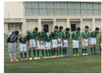
県ハンディキャップ サッカー連盟