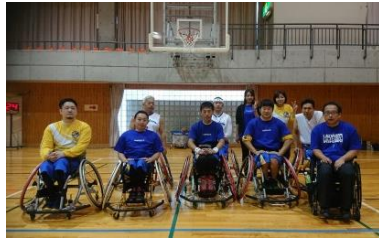
県車椅子バスケットボール連盟 三重チャリオッツ