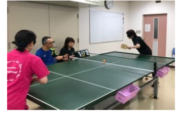
県視覚障害者協会 サウンドテーブルテニス部