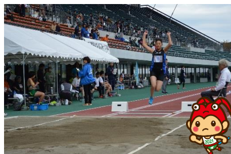
陸上競技 平成30年11月3日(土・祝)