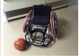
競技用車いす(バスケット)