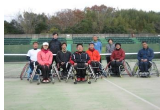
県車いすテニス協会