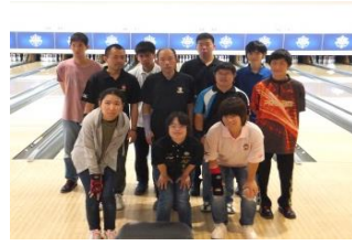
県知的障がい者 ボウリング協会