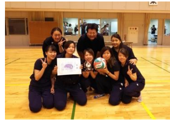
県聴覚障がい者バレーボール部 アイリス