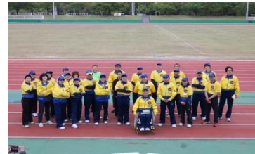
県障害者フライング ディスク協会