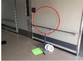
フライングディスク

三重県身体障害者総合福祉センターでは、気軽にスポーツを楽しんでいただけるよう、スポーツ用具の貸し出しを行っています。詳しくは、ご来所、お電話、FAX でお問い合わせください。