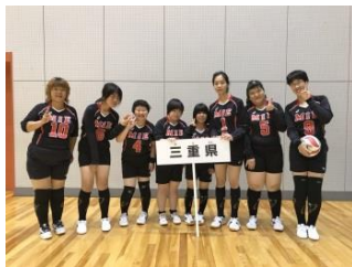
県知的障がい者バレーボールチーム 三重パールズ