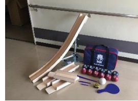
ボッチャ・ランプ