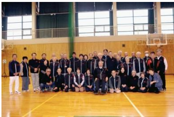
県身障者 スポーツウエルネス吹矢協会