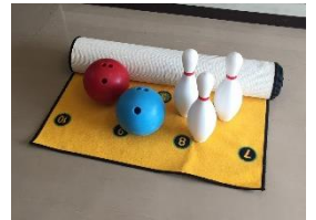
室内用ボウリング