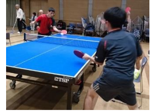
県障がい者卓球協会