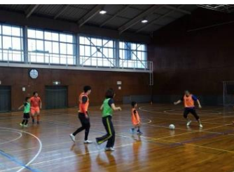
三重ソーシャル フットボールコミュニティ