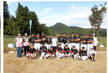
県視覚障害者協会 グラウンドソフトボール部