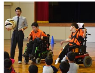
県電動車椅子サッカー協会