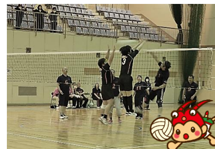
バレーボール(精神障害の部) 平成30年11月25日(日)