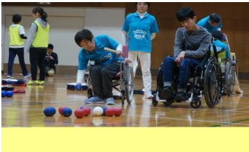
みえボッチャ協会