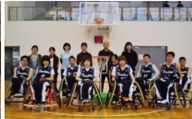
県車椅子バスケットボール連盟 三重フロンティアズ