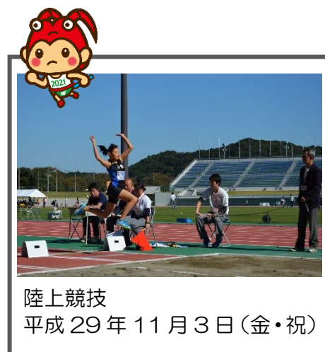
陸上競技 平成29年11月3日(金・祝)