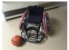
競技用車いす(バスケ)