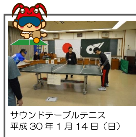
サウンドテーブルテニス 平成30年1月14日(日)

第21回三重県障がい者スポーツ大会が下記日程にて開催されます。本大会は、平成31年10月に茨城県で開催される、「いきいき茨城ゆめ大会」への三重県代表選手の選考会を兼ねており、個人競技は、県内4箇所で開催されます。各大会の申し込みは、3か月前の予定です。HP等を確認して是非ご参加ください。