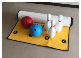
室内用ボウリング