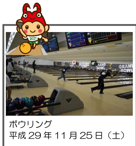
ボウリング 平成29年11月25日(土)