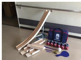
ボッチャ・ランプ