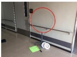
フライングディスク

三重県身体障害者総合福祉センターでは、気軽にスポーツを楽しんでいただけるよう、スポーツ用具の貸し出しを行っています。詳しくは、ご来所、お電話、FAXでお問い合わせください。