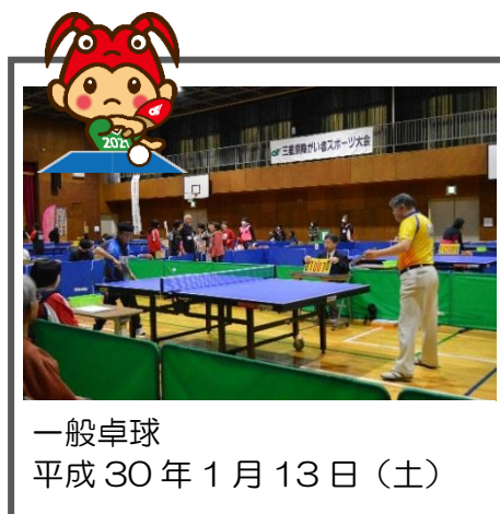
一般卓球 平成30年1月13日(土)