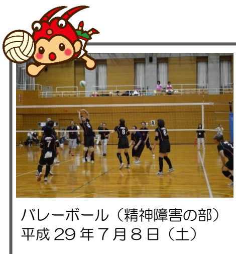
バレーボール(精神障害の部) 平成29年7月8日(土)