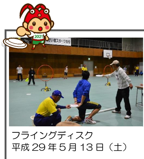
フライングディスク 平成29年5月13日(土)

第20回三重県障がい者スポーツ大会は、5競技に1009名の参加があり、熱戦が繰り広げられました。