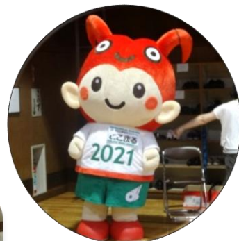
第21回全国障害者スポーツ大会 三重とこわか大会 マスコット“とこまる”