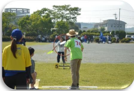
フライングディスク 平成28年5月21日(土)

第19回三重県障がい者スポーツ大会は、4競技に899名の参加があり、熱戦が繰り広げられました。