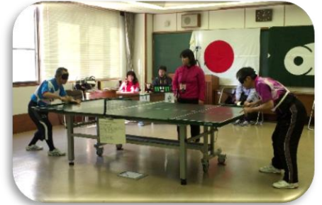
サウンドテーブルテニス 平成29年2月19日(日)

第20回三重県障がい者スポーツ大会が下記日程にて開催されます。本大会は、平成30年10月に福井県で開催される、「福井しあわせ元気大会」への三重県代表選手の選考会も兼ねており、個人競技は、県内3箇所で開催されます。各大会の申し込みは、3か月前の予定です。HP等を確認して是非ご参加ください。