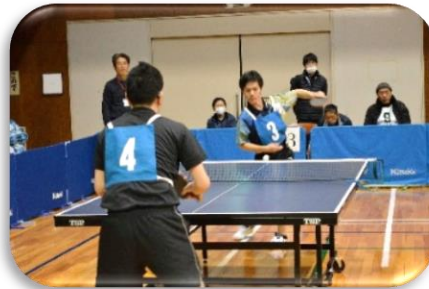
一般卓球 平成29年1月14日(土)