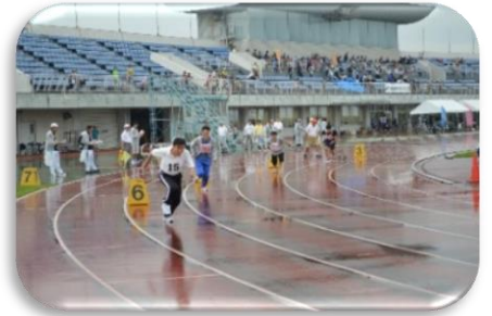
陸上競技 平成28年9月24日(土)