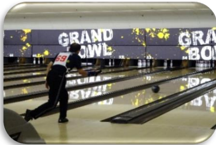
ボウリング 平成28年11月26日(土)