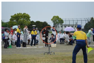
フライングディスク 平成27年5月9日(土)

第18回三重県障がい者スポーツ大会は、4競技に981名の参加があり、熱戦が繰り広げられました。