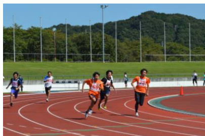
陸上競技 平成27年10月3日(土)