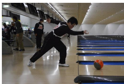
ボウリング 平成27年12月5日(土)