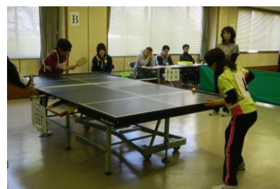
サウンドテーブルテニス 平成28年1月31日(日)

第19回三重県障がい者スポーツ大会が下記日程にて開催されます。本大会は、平成29年10月に愛媛県で開催される、「愛顔つなぐえひめ大会」への三重県代表選手の選考会も兼ねており、個人競技は、県内3箇所ですべて4競技が開催されます。各大会の申し込みは、3か月前の予定です。HP等を確認して是非ご参加ください。