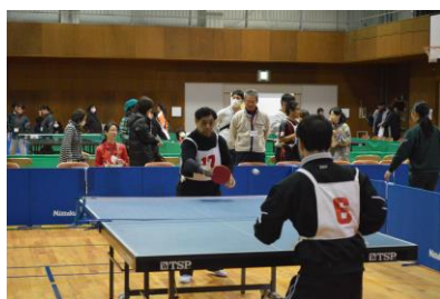
一般卓球 平成28年1月24日(日)