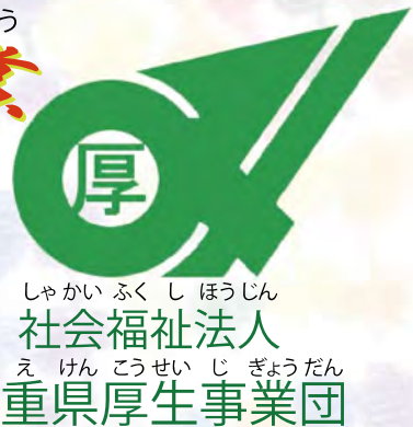
イラスト ほづみはるひ さま 穂積遥陽 様